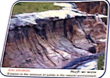
EROSION Exposed to the removal of solids in the natural environment