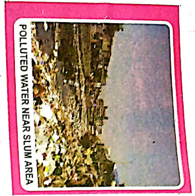
POLLUTED WATER NEAR SLUM AREA