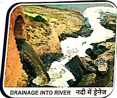
DRAINAGE INTO RIVER नदी में ड्रेनेज