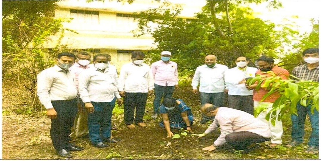
Professors of the college while planting trees in the college premises on the occasion of Agriculture Day