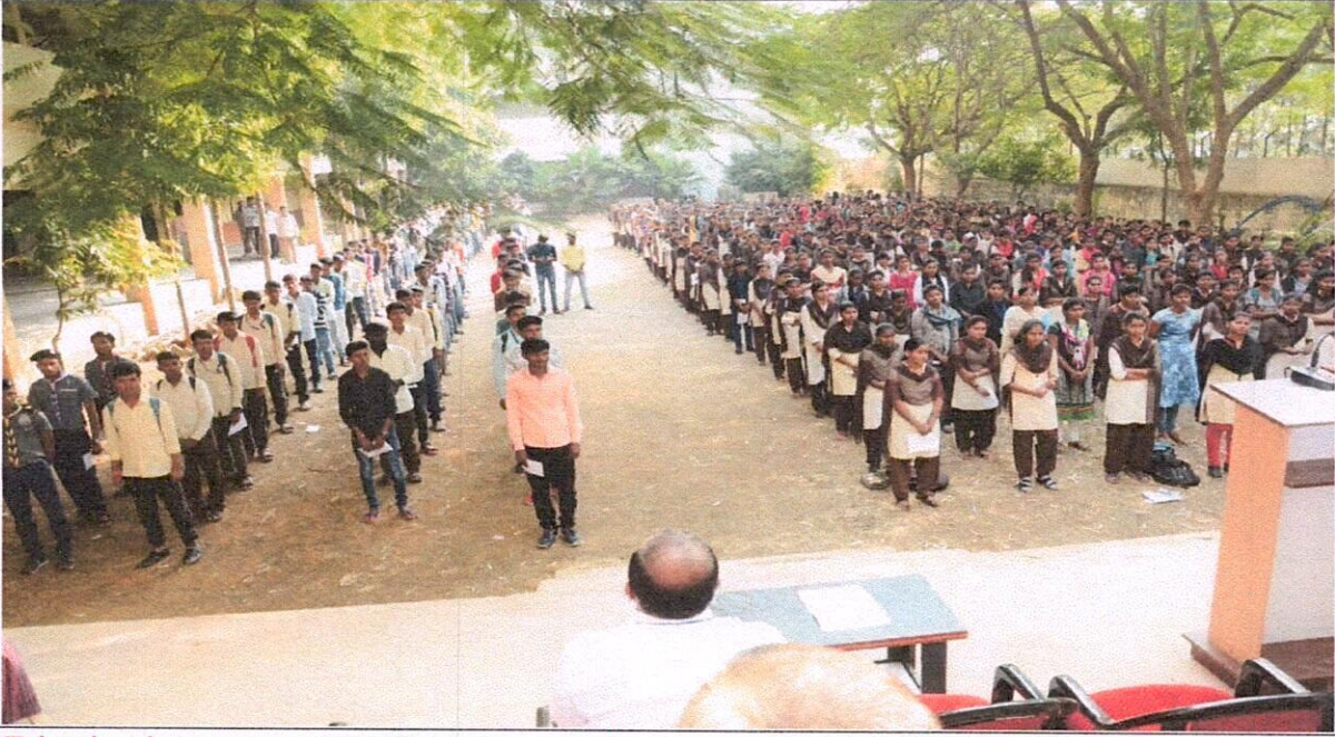
Dignitaries present on the stage on the occasion of National Unity Day... taking oath on the purpose of the National Unity Day