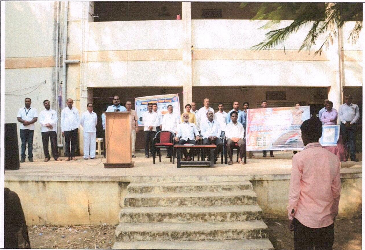
Dignitaries present on the stage on the occasion of National Unity Day... taking oath on the purpose of the National Unity Day