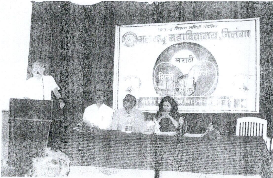
भाषा वाडमंत्र मंडल उद्घाटन समारोह का समापन करते समय प्राचार्य वही.एल.ए.एंडे