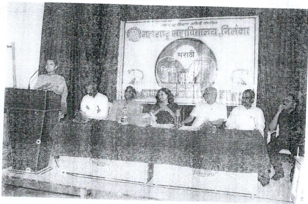
भाषा वाडमंत्र मंडळ के उद्घाटन अवसर पर छात्रा अपनी मनोगत व्यक्त करते समय