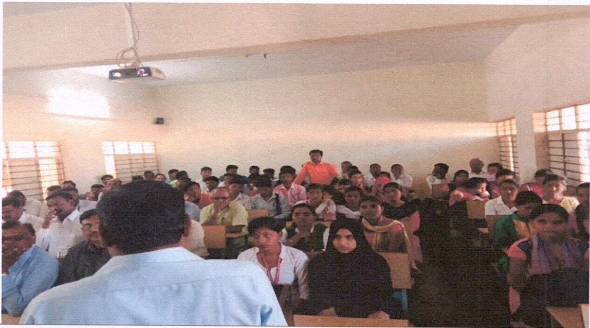
Students present in the program "Constitution of India" organized on the occasion of Indian Constitution Day