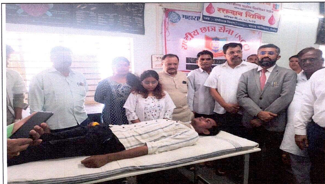
Volunteers of National Service Scheme donating blood under Blood Donation Camp and President of the organization Hon'ble Vijay Patil Nilangekar Sahib and other dignitaries.