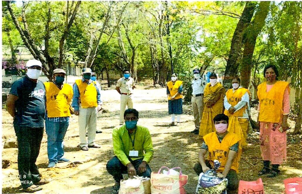
A moment of Food distribution