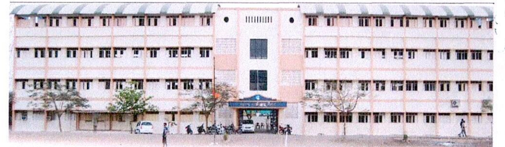
महाराष्ट्र महाविद्यालयाचे इनडोर स्टेडियम