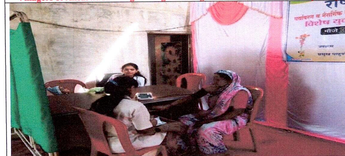
Villagers of Ansarwada village taking advantage of the free health check-up camp