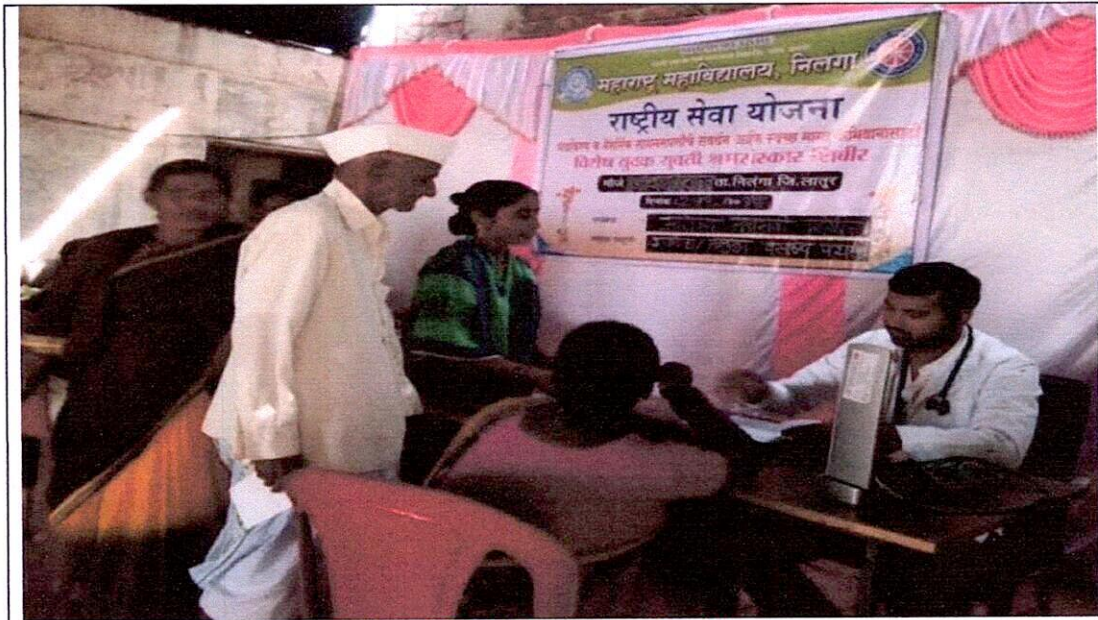
Health officials inspecting the villagers.