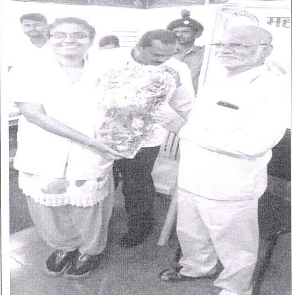
रक्तदान शिविरात सहकार्य लाभलेल्या डॉ.चे स्वागत करताना महाविद्यालयाचे प्राचार्य.