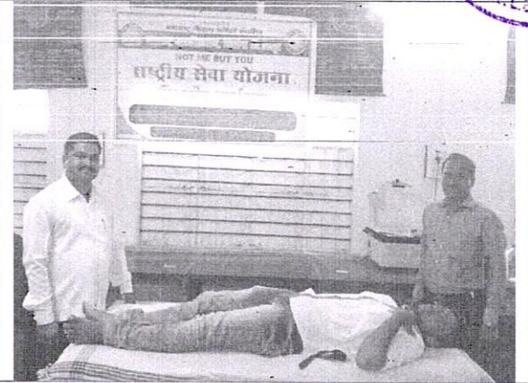
रक्तदान करताना रा.से.यो.स्वयंसेवक