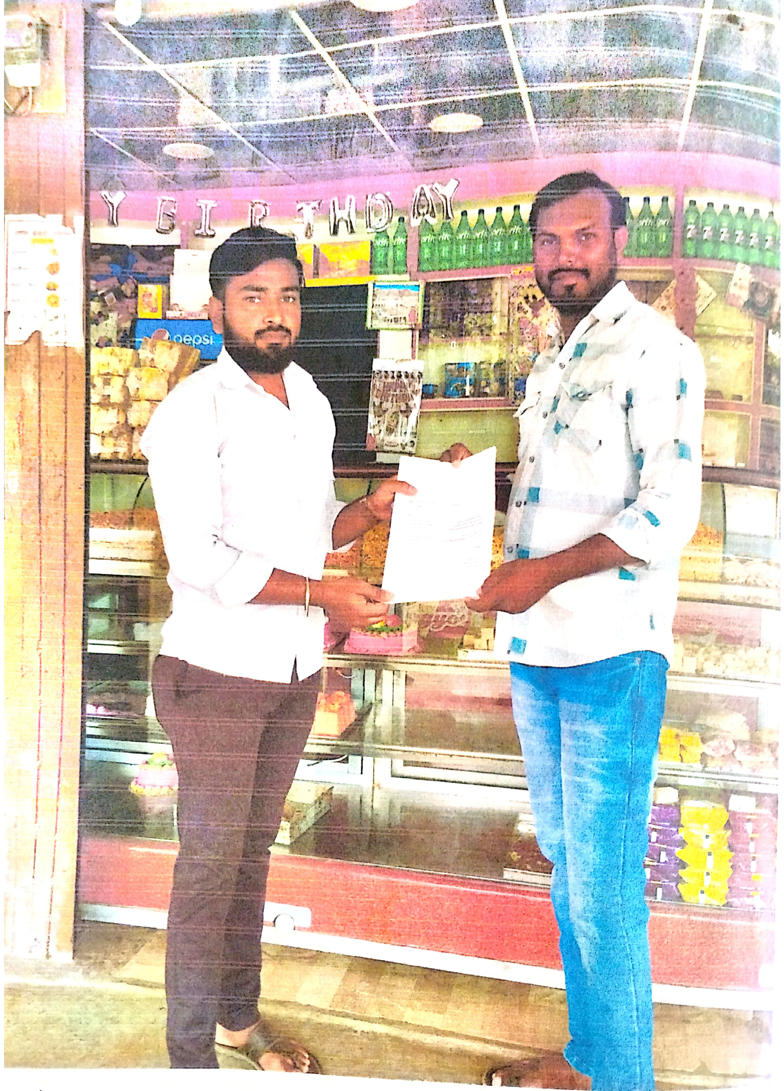
मशाजे मालक शिष्याकडून प्रमाणपत्र विकतवाना.