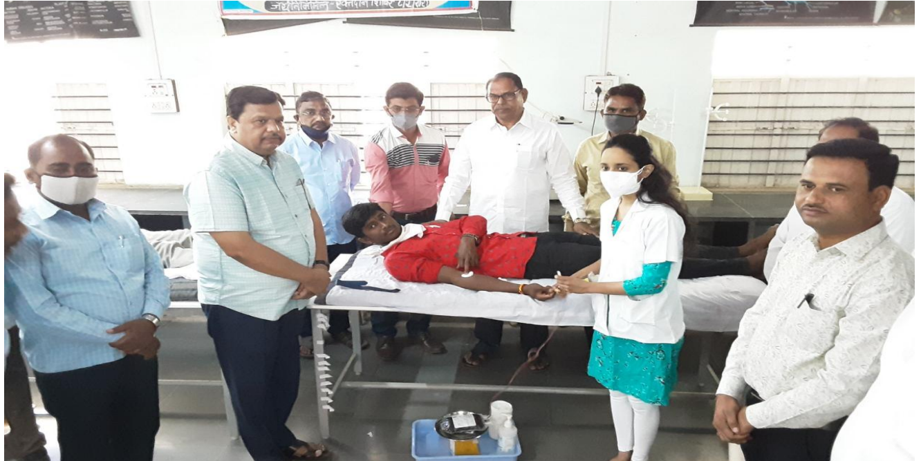
Students and staff of the college while donating blood