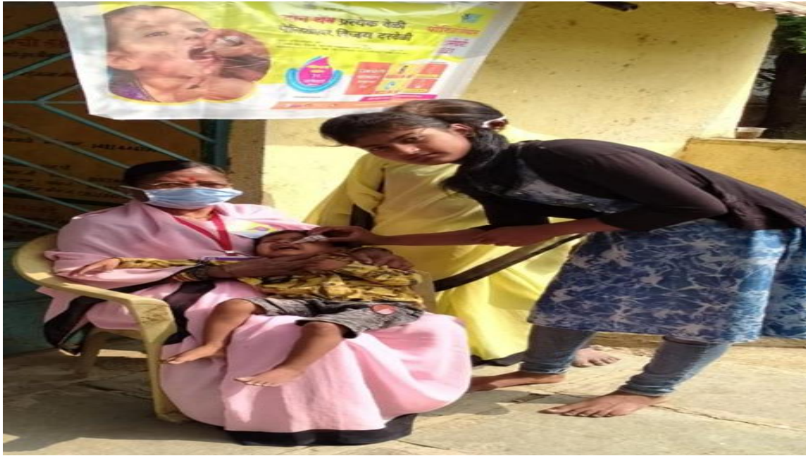
Pulse Polio Abhiyaan, in a special campaign