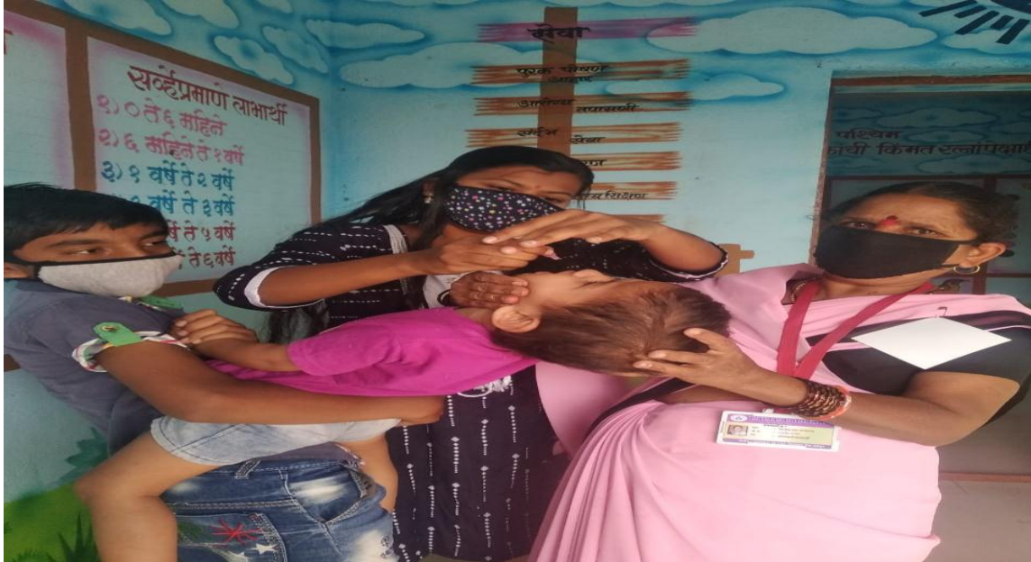
Pulse Polio Abhiyaan, in a special campaign

Under Pulse Polio Abhiyaan, in a special campaign called Do Bund Zindagi K, college students administered polio doses to children in Anganwadis, schools, and clinics.