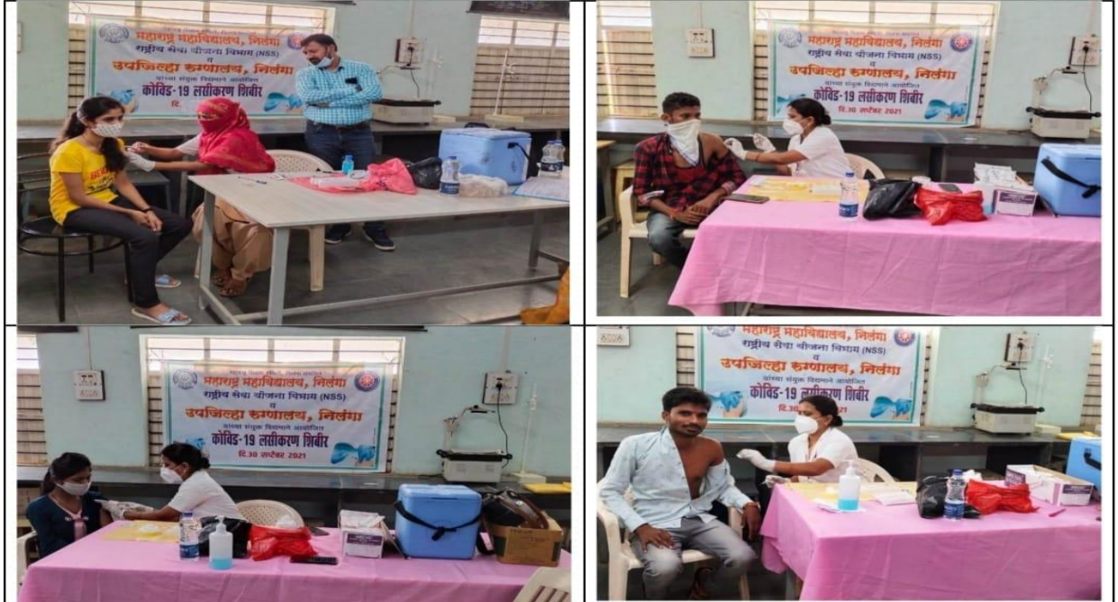
उपजिल्हा रुग्णालय निलंगा यांच्या सहकार्याने आयोजित कोविड १९ लसीकरण शिबिरातील क्षणचित्रे.

Maharashtra College, Nilanga in association with Sub district Hospital, Nilanga was following the rules of covid-19 epidemic in the college premises. The Covid 19 vaccination campaign was successfully organized three times